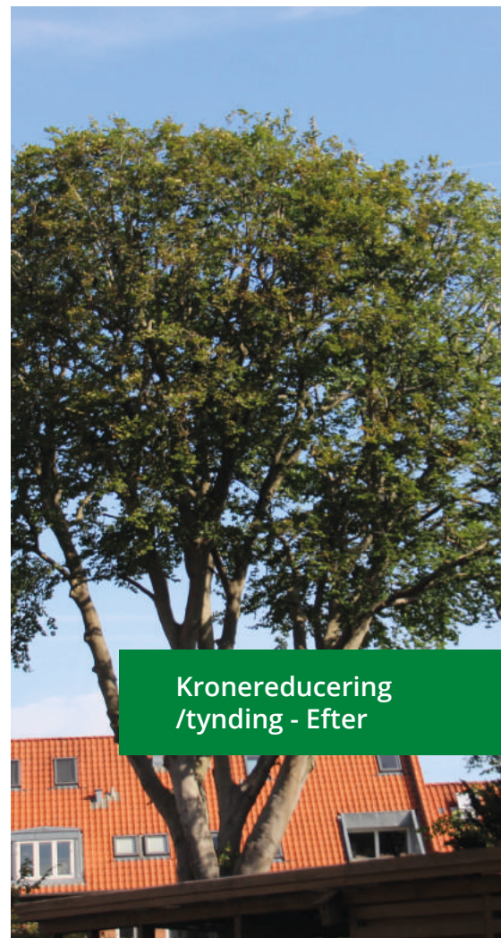
Kronereducering /tynding - Efter