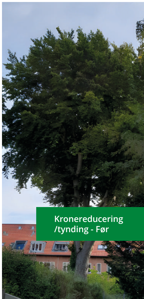
Kronereducering /tynding - Før